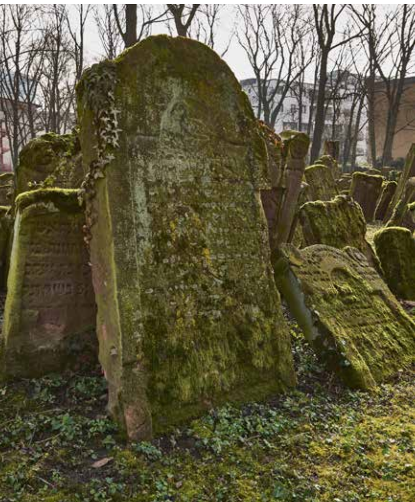
Friedhof Battonnstraße