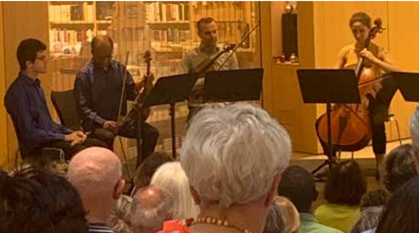
Ensemble Modern, © Jüdisches Museum Frankfurt

Seit dem Jahr 2017 veranstalten die Gesellschaft der Freunde und Förderer des Jüdischen Museums und die Freunde des Ensemble Modern e. V. Kammermusikkonzerte mit Werken jüdischer Komponistinnen und Komponisten. Viele von ihnen wurden während der NS-Zeit verfolgt und ermordet, wie Erwin Schulhoff und Viktor Ullmann.