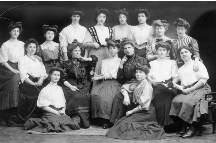
Pensionat Ettliger im Röderbergweg, Bewohnerinnen, um 1908

Sonntag 11.00 – 14.00 Uhr Mittwoch 17.00 – 19.00 Uhr ↗ Hochbunker, Friedberger Anlage 5 – 6