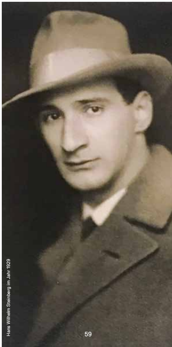
Hans Wilhelm Steinberg im Jahr 1929