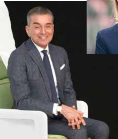
Prof. Dr. Dr. Michel Friedman