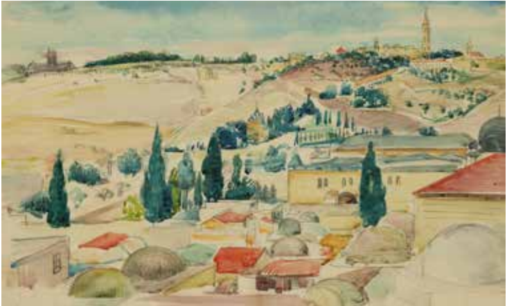
Armin Stern, Jerusalem, 1933

Die Teilnehmerzahl für Führungen ist begrenzt; Platzreservierungen unter juedischesmuseum.de/tickets