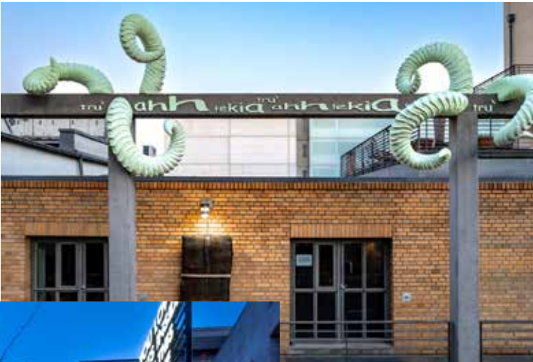
Anselm Baumann, Crown of Horns, 2024